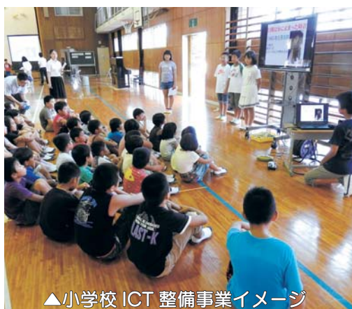
▲小学校 ICT 整備事業イメージ