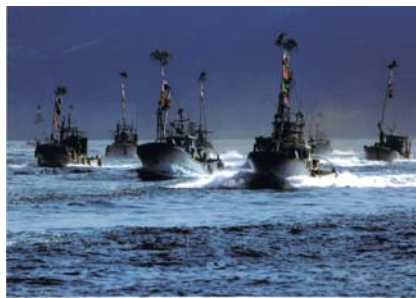
▲【優秀賞】「大漁 パレード」吉田八郎