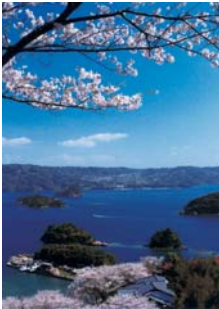
▲【入選】「春爛漫」横山善久