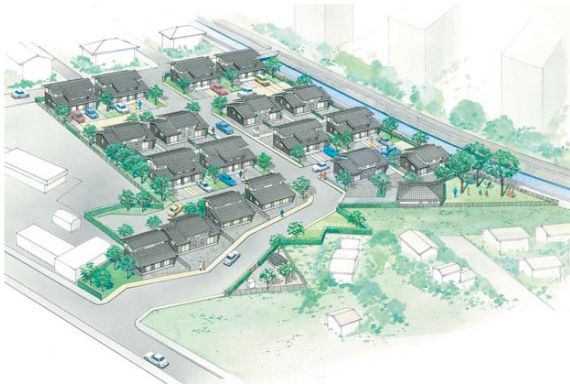
▲今福定住促進住宅完成イメージ