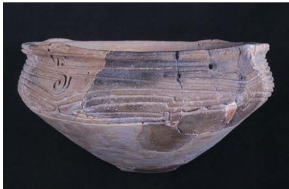
磨消縄文土器（五島市白浜貝塚出土）

松浦でも鷹島町三代遺跡、御厨町池田遺跡や志佐町楼楷田遺跡から磨消縄文土器が、楼楷田遺跡や御厨町下谷遺跡からは十字形石器が出土しています。