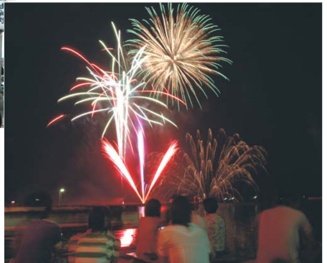
7/28 疫神社夏祭り今福花火大会 (松浦商工会議所今福支部青年部主催)