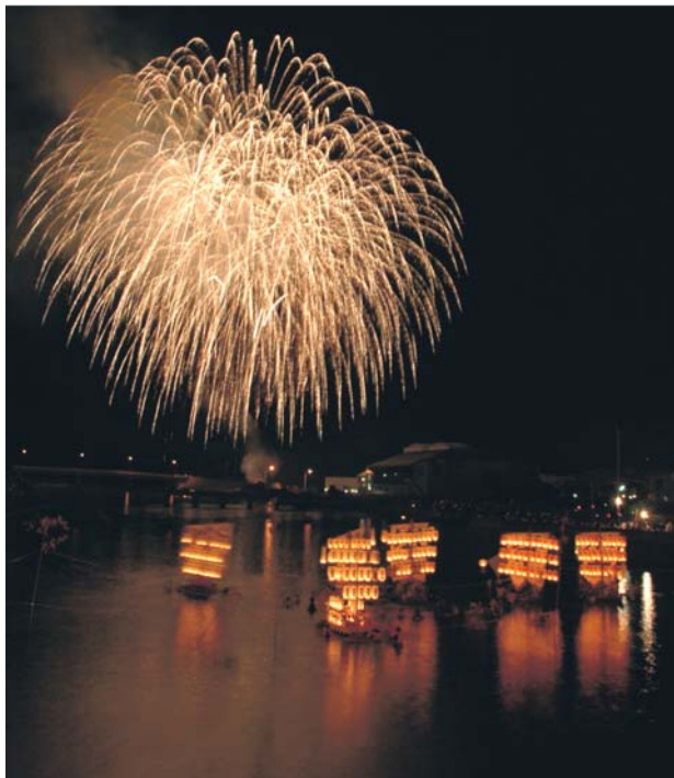
8/15 志佐町納涼花火大会 (志佐商工振興会主催)