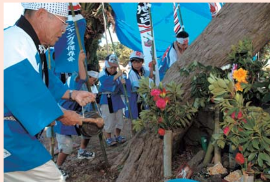
牟田じゃんがらの様子