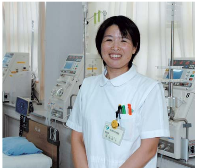
市民病院の透析室で。