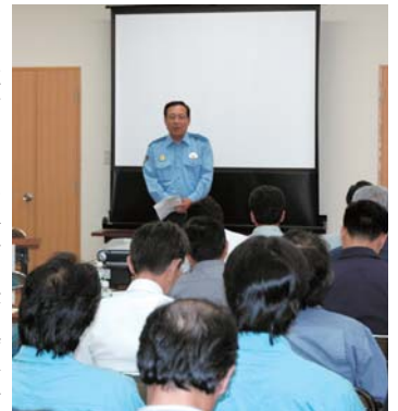
▲松浦魚市場での大会の様子

今後は、本委員会と松浦署が強力なスクラムを組んで、暴力団等反社会勢力の存在と不当要求を許さない「安全で安心な住みよい松浦市づくり」に取り組んでいきたいと思います。