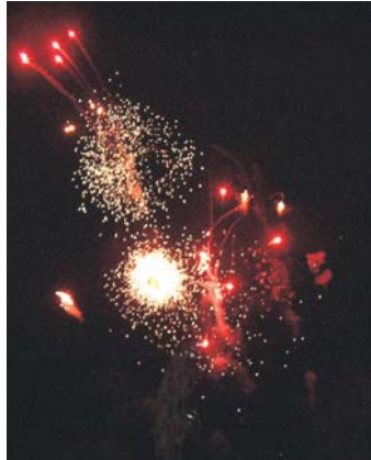
8/12 鷹島町花火大会 (鷹島青年団主催)