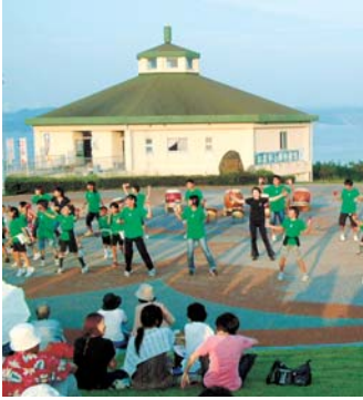
7/25 鷹島モンゴル村 夏まつり (鷹島公社主催)

今年も、市内各地域で夏まつりが行われ、地元住民や子どもたちも元気に参加しました。