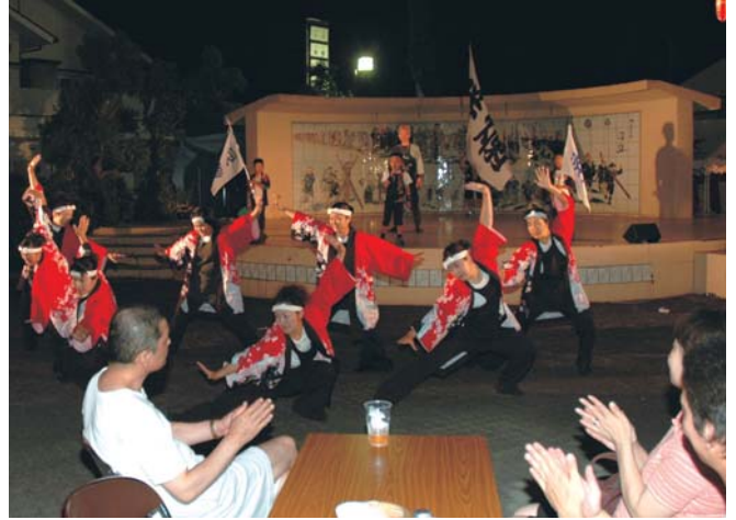
8/14～8/15 福島町夏まつり (松浦市福鷹商工会青年部主催)