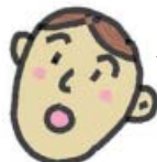
【健診を受けている人の声】