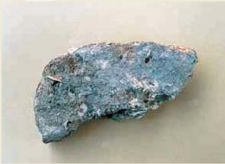
▲自然乾燥して保管している漆喰塊

また、磚の表面に漆喰と炭化物が付着したものもあり、漆喰はカマドを組む磚の接着剤としても使用されていたと考えられ、現在も専門家による漆喰の分析が行われています。