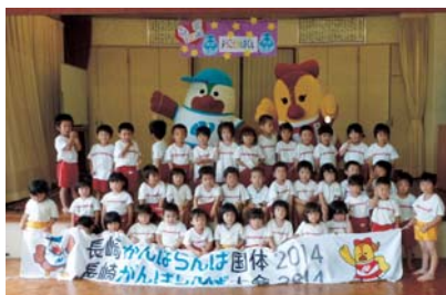
▲松浦幼稚園でのGo!Go! がんばくんの様子

着ぐるみ“がんばくん”の借用には申請が必要です。申請方法については、上記の問合せ先へお尋ねになるか、市ホームページの長崎国体松浦市実行委員会でご確認ください。