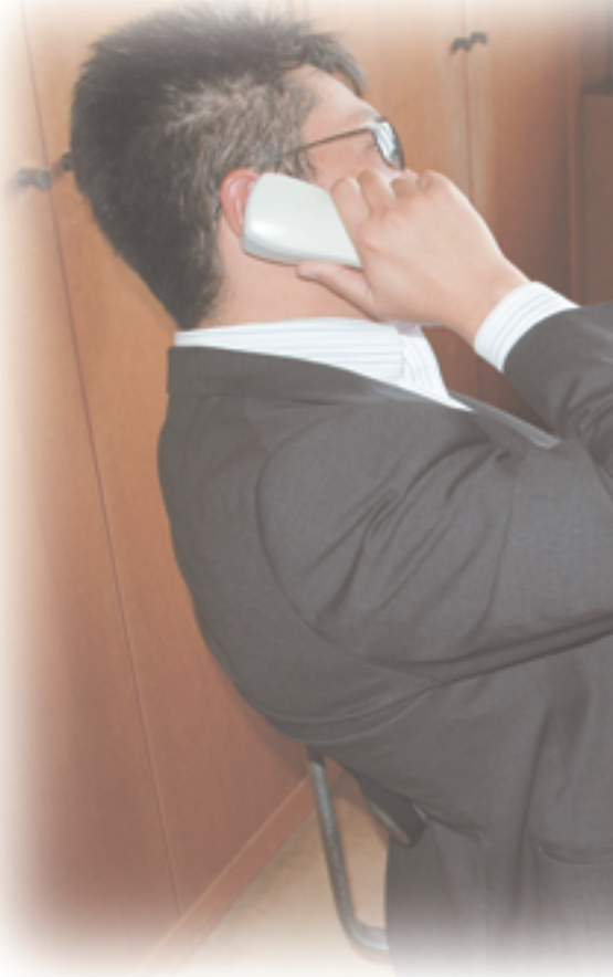
※写真は市職員によるイメージです。

振り込め詐欺は、両親や身内の人が子どもや孫を心配する心のすきに入り込み、多額の現金を振り込ませる悪質な犯罪です。被害に遭う人のほとんどは、「振り込め詐欺については知っていたが、まさか自分が被害に遭うとは思っていなかった」と話しています。今月号では、振り込め詐欺の事例や被害に遭わないようにするためのポイントなどを紹介します。