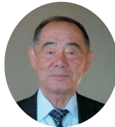
株式会社つばき荘 代表取締役

【見学コース】 ロビー→レストラン→温泉大浴場→宴会場→3階フロア（客室・テラス）→2階フロア（客室・特別室）