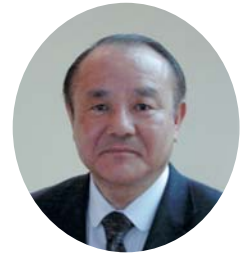
福島温泉 ほの香の宿 つばき荘 支配人