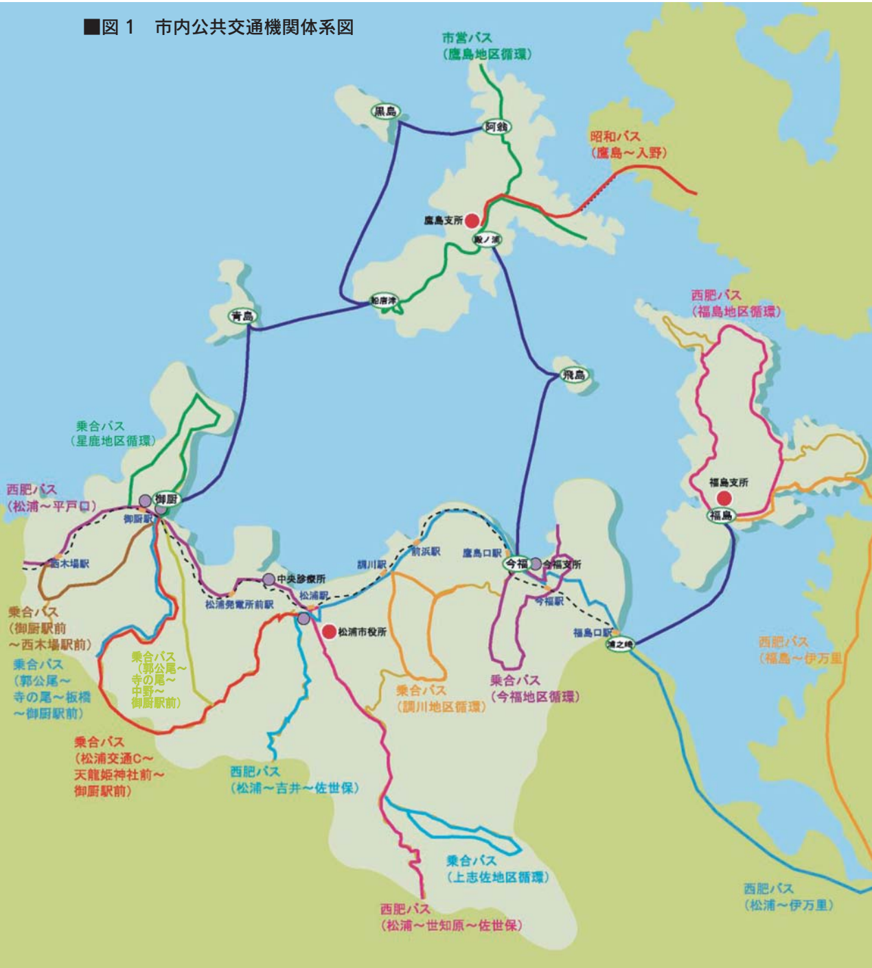
■ 図1 市内公共交通機関体系図