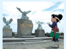
鷹島肥前大橋開通記念 モニュメント (必勝モニュメント)