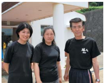
●講師 肥前福島玄蕃太鼓の会

6月6日(木)に福島町の養源保育所の3〜5歳児の園児たちが和太鼓講座を受講しました。地元で活動している肥前福島玄蕃太鼓を子どもたちにも体験させたいと申し込みがありました。 子どもが対象であるため、講師は子どもに合わせたリズムの楽譜を作り、集中力が途切れないよう休憩を挟みながら練習を進めました。 子どもたちはすぐに太鼓に慣れた様子で、「トン・テン・トン」の掛け声に合わせて全身を使って元気いっぱい楽しんで太鼓を叩いていました。 練習の成果は16日の運動会で披露しました。11月のなかよし発表会でも披露する予定です。