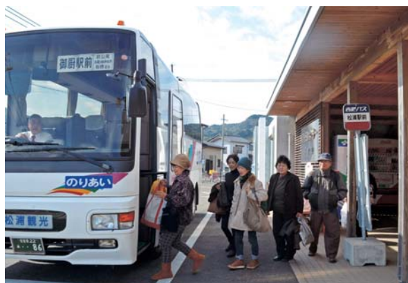
▲ わくわく・おでかけ支援事業