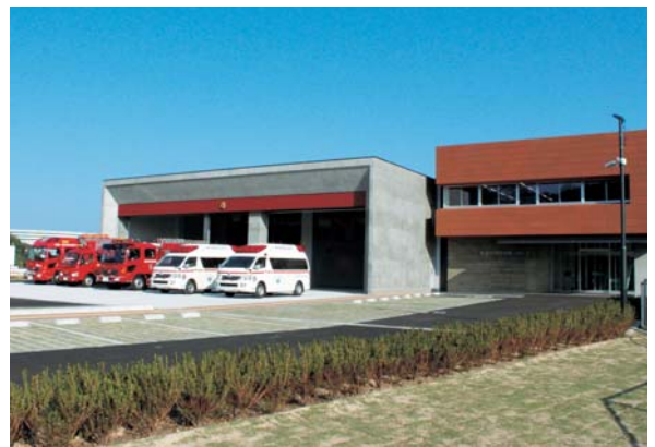
▲ 消防庁舎建設事業