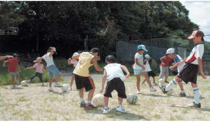
昨年度の講座の様子【子ども（サッカー）編】