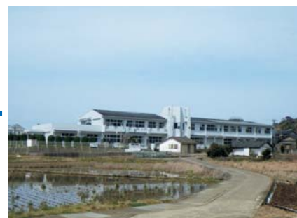
▲原子力災害対策施設整備事業…玄海原子力発電所において、万が一の緊急事態に一時的な避難ができる屋内退避施設として、青島小中学校校舎を整備