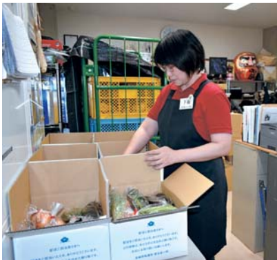
丁寧に梱包しています！