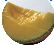
松浦アールスメロン