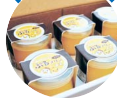
たまごやさんの ぷるプリン