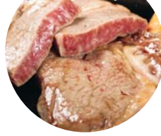
長崎和牛ロース ステーキ