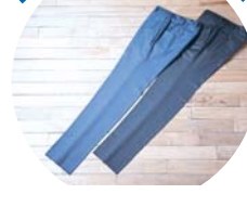
オーダーラックス