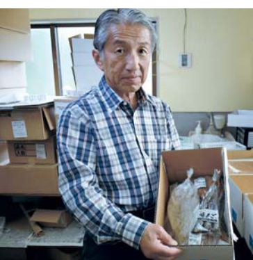
ひとつずつ手作業で確認しています！