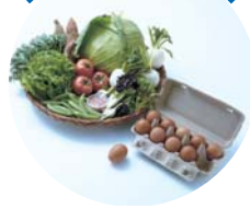
野菜と卵のセット