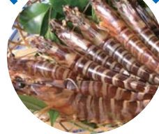
玄海活きくるまえび