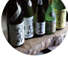
焼酎飲み比べ 5本セット