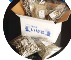
逸品いりこと やきあごの詰合せ