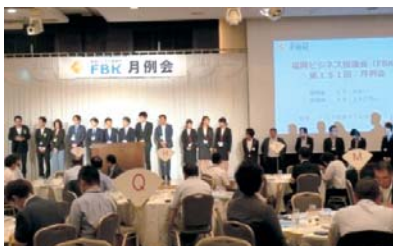
◀会員企業PRやブース商談会等で盛り上がるFBK月例会

また、今年度は、企業見学会にエントリーし、西部ガス食文化スタジオでの松浦産食材を使った料理教室の開催や分科会・愛好会による松浦ツアーの案内など、ビジネス分野での認知度向上と誘客の取り組みを進めています。