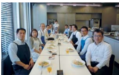
◀企業見学会では料理体験を通して松浦の食と観光の魅力をアピール