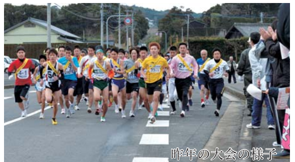
昨年の大会の様子