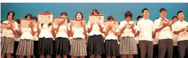
9/10 松鵬祭でのプレ発表の様子