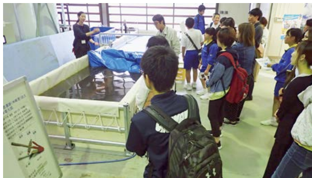
▲今福中学校1年生の様子