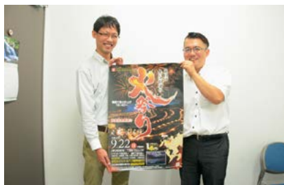
▲西日本新聞社を訪問