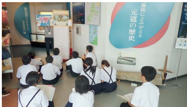
▲志佐中学校1年生の様子

志佐中学校および今福中学校の1年生は、「地域を知る」というテーマのもと、総合的な学習に取り組んでいます。その一環として、松浦市立埋蔵文化財センターバスツアーを6月28日に志佐中、8月26日に今福中で実施しました。特に、今福中学校は、歴史で事前学習として文化財課職員による出前講座も行い、当日は、親子レクレーションを兼ねて保護者も参加されました。文化財課では、地域の歴史や文化財について学び、故郷に対する思いを深めるための取り組みを進めていきます。