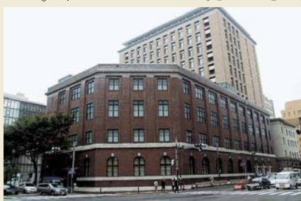
▲ 横浜ユーラシア文化館外観

この展覧会に関する詳細は、横浜ユーラシア文化館までお問い合わせください。 ☎ 045-663-2424