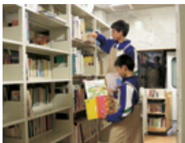
職場体験学習の様子

A. 館長「今、中学校・高校では1、2年で「職場体験学習」、教職員では「社会体験研修」という学習・研修が取り入れられています。早い段階で職業についての予備知識を勉強し、その後の進路選択に生かすという目的（教職員は視野の拡大・社会性の向上を図るなどの目的）です。3～4日間の体験ですが生徒の皆さんは大きく成長しています。図書館では今年度4中学校9人、1高校1人、教職員4人を受け入れます。利用者の皆さんよろしくお祈りします」