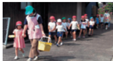
▲福島町ひかりヶ丘保育園での様子

保育園からの要望で巡回が始まったひかりヶ丘保育園。しかし道が細くきらきら号が入ることができません。そこで少し離れた伊万里釜会館の駐車場を借りて貸し出しを行ってあります。暑い日も寒い日も仲良く手をつないで歩いてきてくれます。