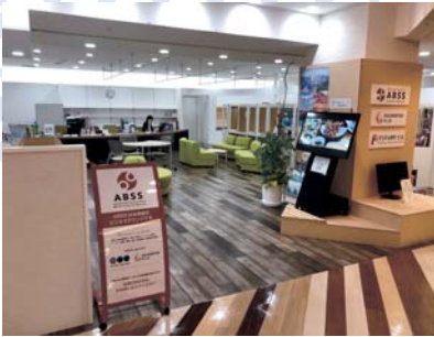
◀福岡市天神イムズ 3階フロアの一画