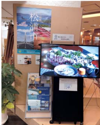
松浦市のポスターや パンフレット、デジ タルサイネージを 設置▶

福岡事務所は、福岡市観光案内所、アクロス福岡 1 階文化観光情報ひろば、福岡市役所 1 階九州情報ひろば等にパンフレットを設置するとともに、各会合やメディア、雑誌等を通じて松浦市の魅力や情報を発信しています。福岡市の中心部にある天神イムズもその一つです。これまで天神イムズでは 8 階のラウンジで松浦市の情報を発信してきましたが、2 月からはより人通りが多い 3 階にその場所を移しました。