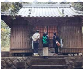
▲「松浦ぶらり旅」の様子