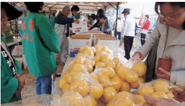
▲ 昨年の松浦メロン祭りの様子