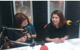
「コミてん」生出演の様子

お問い合わせ・ご意見など 松浦市福岡事務所 ☎092-406-2180 Eメール matsuura.f@city.matsuura.lg.jp