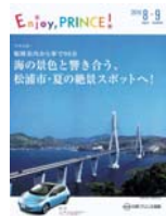
日産プリンスとのタイアップ誌