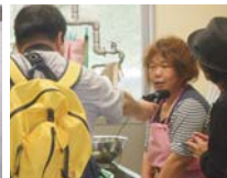
出会いと友好の証。3本指でミーツ!