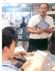
『鷹ふぐバル松浦4th～meets!まつらバル婚～』

お問い合わせ・ご意見など 松浦市福岡事務所 ☎092-406-2180 Eメール matsura.f@city.matsura.lg.jp