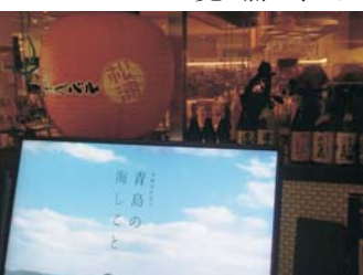
エントランスに新設した「サイネージ（電子看板）」

さて、PRといえば、バルに新しいPRツールも登場しています。エントランスに新設した「サイネージ（電子看板）」では、松浦市の観光用動画が常時オンエア。天神のど真ん中、イムズですから通行人はもちろん、ランチの空席待ちの間にも、たくさんの方の福岡の皆さんに松浦市の美しい風景などをご覧いただけます。