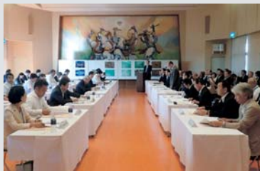
▲意見交換会会場の様子

また、意見交換会も行われ、市議会、地元住民代表から、海底遺跡の抱える課題や遺跡の活用策についての意見が出されました。文部科学委員からは、「元寇船の活用策」や、「海底遺跡を活かした観光対策」、「アジアの共有財産にしていきたい」に関係国との連携などについての意見をいただきました。