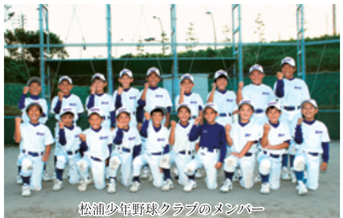
松浦少年野球クラブのメンバー