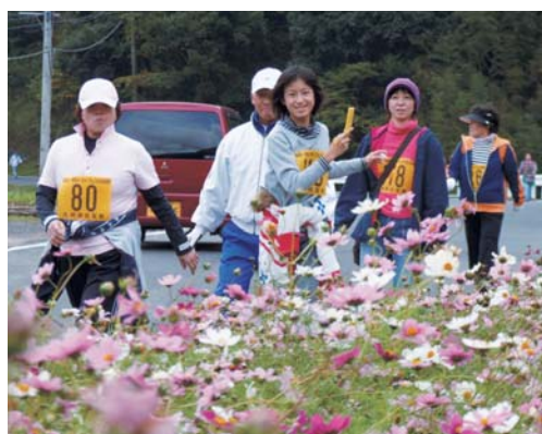
昨年度のフェスタの様子