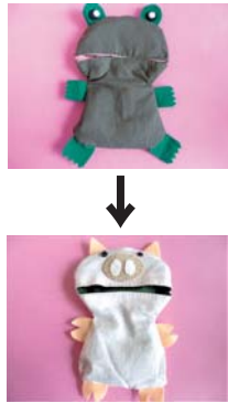
※ひっくりかえすとぶたに変身！