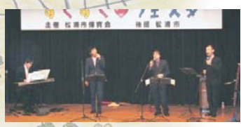
木管アンサンブル・POE