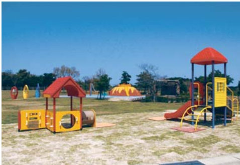
▲ 不老山総合公園内の遊具