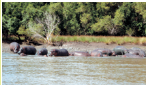
▲報告会后同期隊員と小旅行。ワミ川で日向ぼっこするカバ達。