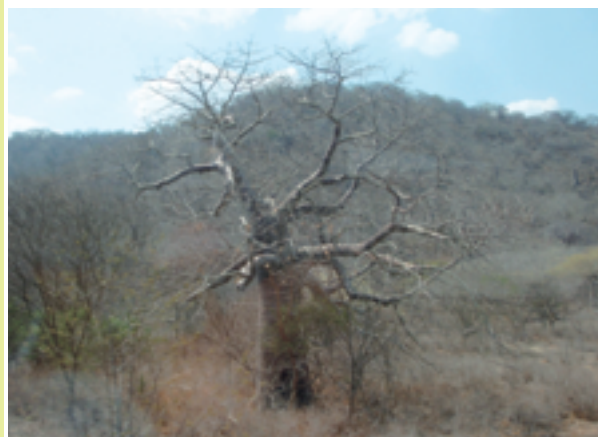
▲バスの窓からみるイリングまでの道のり。4時間程こんな風景が続きます。

任期半分を終え中間報告会が行なわれました。ディスカッション形式に進められた報告会では職種の違い、職場の違いから抱える問題も様々で、自身の活動上では起こらないような問題、また、職種は違えど同じような問題を抱えた隊員の話しを聞くことができました。