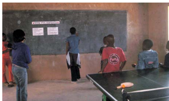
▲スワヒリ語のボロが出るので、記入は書記役をかっててくれた子。すでに張ってあるのは基本の姿勢。