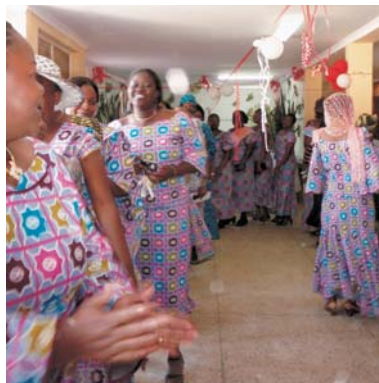
▲参加者は同じ布を買い、思い思いのデザインで服を作ります。