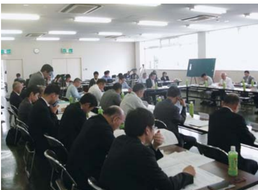
玄海原子力発電所に係る長崎県、松浦市及び九州電力株式会社安全連絡会の様子

本市は、現在策定中の松浦市原子力防災避難行動計画の進捗状況について説明を行ったほか、九州電力(株)に対して安全協定締結に向けての考え方を、県に対しては、本連絡会の構成メンバーの見直しなどについて意見を求めました。