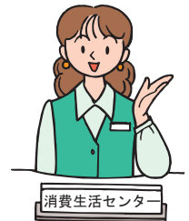
消費生活センター