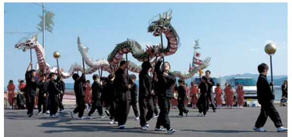
▲御厨蛇踊りの子蛇2体