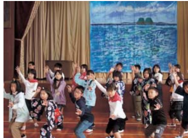
▲練習をする鷹島小の児童