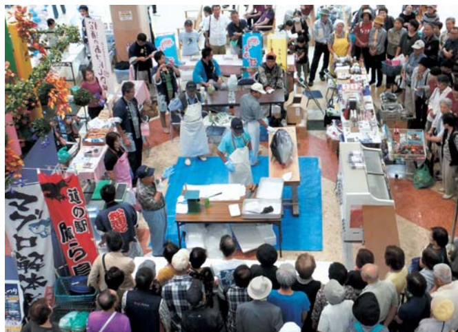
▲ マグロ解体ショー