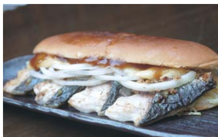
▲ 松浦旬さばサンド

サバサンドが福岡の新定番となりつつある中、この日販売された、当日限定鷹ふぐバル松浦特製「松浦旬さばサンド」は好評完売となりました。