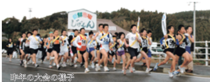
昨年の大会の様子