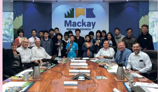
▲前回の松浦市青少年親善使節団

市外の中学校、高校へ通学している人につきましては、直接協会事務局まで連絡してください。