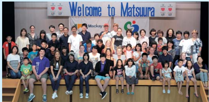
▲前回の使節団とホストファミリー