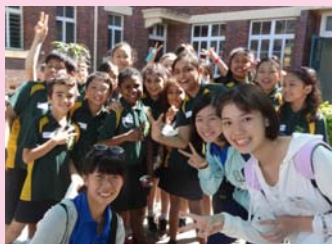
▲前回の松浦市青少年親善使節団