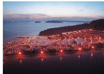
一昨年の火祭りの様子

棚田の畦道に設置された約2,000本のたいまつに火が灯されると、幻想的な光景が浮かび上がります。 日時 9月23日（日）午後6時30分 点火予定 ※小雨決行（悪天候の場合は翌日に順延）