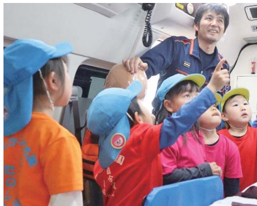
▲園児に救急車内の説明をしている様子。

消防署を訪れた園児に庁舎および車両の説明を行いました。園児は、質問を交えながら興味津々で聞いていました。