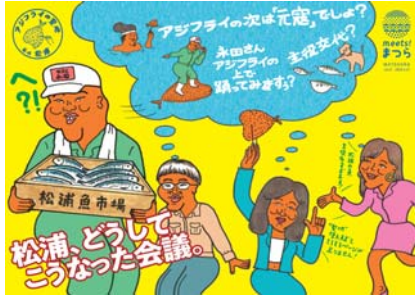
▲ meets! まつら vol.21 表表紙