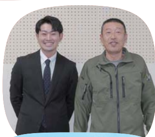
指導された辻部会長（右）