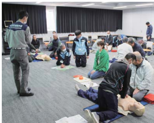
▲心肺蘇生法とAEDの取り扱いを行っている様子。

消防本部庁舎において、松浦市内の自主防災組織の皆さまへ普通救命講習を実施しました。