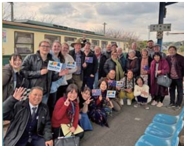
▲松浦鉄道貸し切り列車に乗車

団員の皆さんからは「皆さんの温かいおもてなしに感謝している。決して他では得る事ができない経験ができたことを嬉しく思う。これからも松浦市民の皆さんとの絆を大切にしていきたい。」と感想が聞かれました。