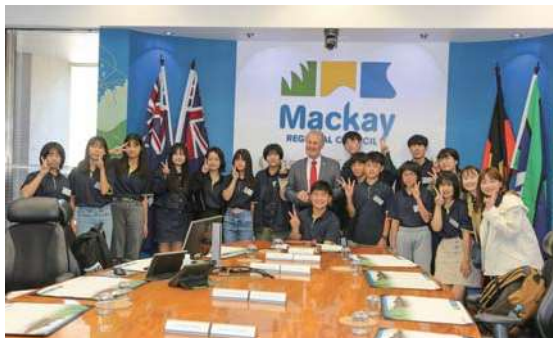
▲令和5年度の使節団の様子