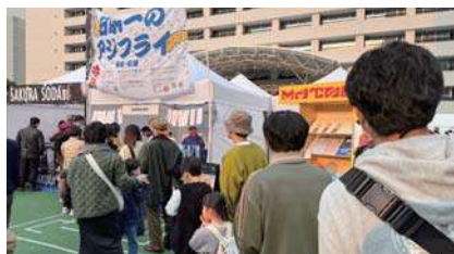
▲「LOVE FM FESTIVAL2024」の様子