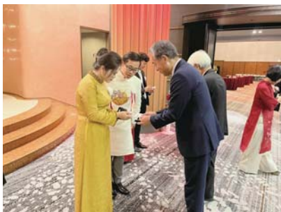
▲総領事との名刺交換

国内・国外での交流を広げることで元寇の歴史に新たなストーリーを盛り込み、多角的な視点での松浦市のPRができるように取り組みを進めていく必要があると思いました。