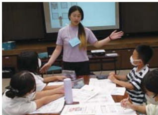
▲道案内の英語練習