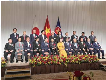
▲参加者の記念撮影