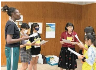
▲オリジナルの劇を作る様子

8月18日(金)生涯学習センターにおいて、市内小学5・6年生を対象としたEnglish Day Campが開催されました。